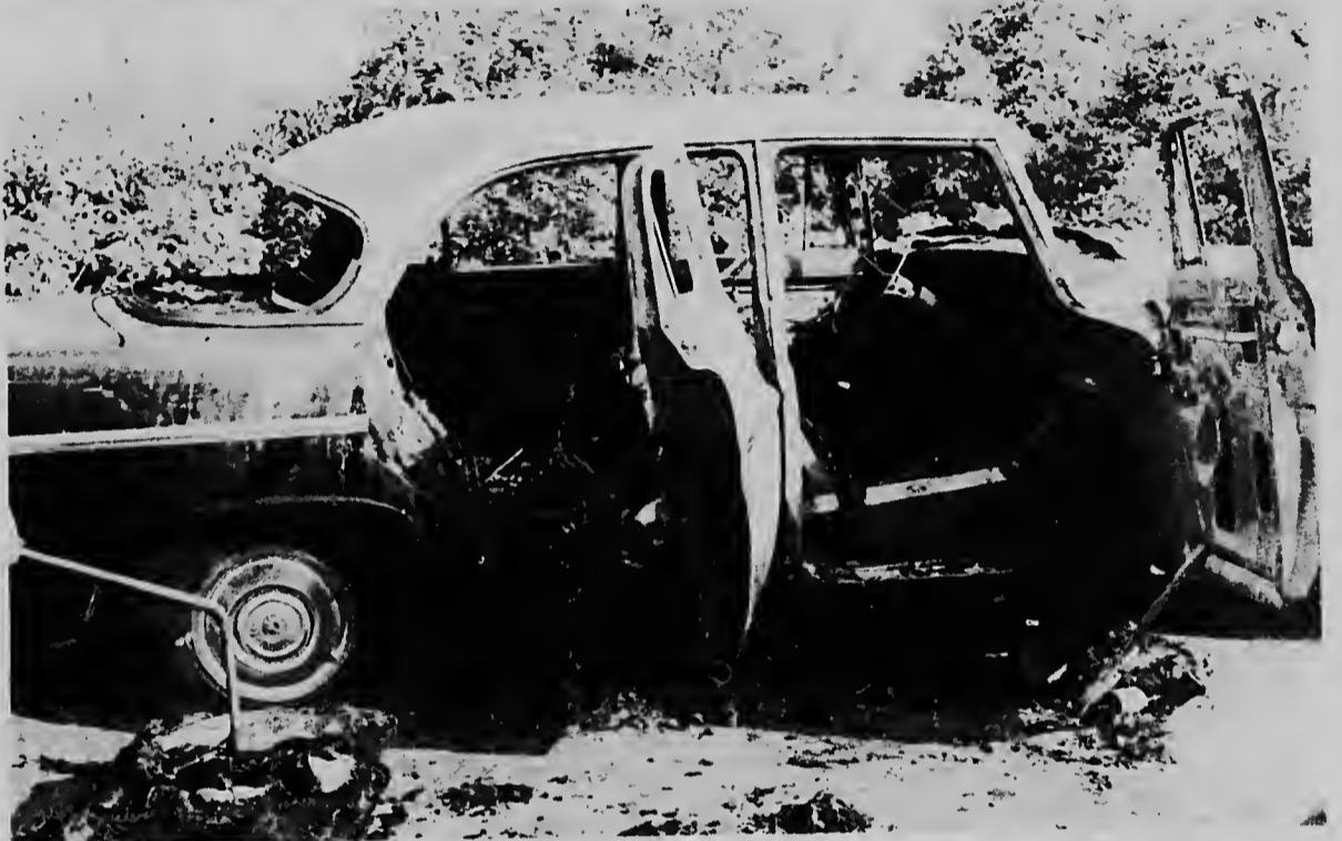
Esaki ta e manera cu e auto a queda despues cu e muher a sende e chauffeur na candela. Riba e cusinchi cu tini abau na suela banda di e auto, nan a haña un sanbechi cu cual e muher ta pretende e homber a menase cu ne.